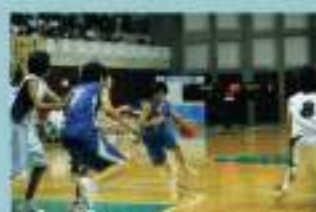
女子バスケットボール部

インターハイ優勝の女子バスケットボール部、全国高等学校ダンスドリル選手権大会優勝のダンス部、全国大会出場の文芸部、パワーリフティング部。他にも陸上競技部などが県大会の上位の成績をおさめています。また、吹奏楽部をはじめ、多くの部活動が地域と連携した活動も行っており、自らの力を養うために日々まじめに取り組む姿はととも輝いています。