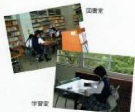
授業を選択していない時間の過ごし方